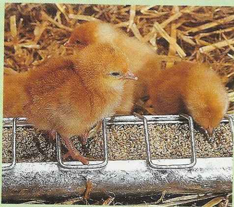
Un matériel spécifiquement adapté aux besoins des poussins évite le gaspillage des aliments.

allumez la lampe pour que la poussinière atteigne la bonne température pour les recevoir. Maintenez une atmosphère chauffée à 33 °C. Diminuez peu à peu la température, semaine après semaine, en passant à 26 °C, puis à 24 °C, 22 °C et en fin 20 °C. Changez la litière dès que l'odeur d'ammoniaque devient perceptible. Le duvet des poussins doit toujours rester bien propre.